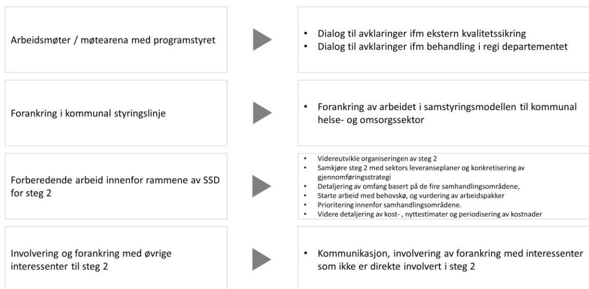
Figur 1 – Videreføring av samarbeidet inn i 2022

Det er mange interessenter til steg 2 som ikke har deltatt aktivt i arbeidet med forprosjektet. Det planlegges derfor et arbeid med kommunikasjon, involvering og forankring som i løpet av satsingen vil bli direkte eller indirekte påvirket.